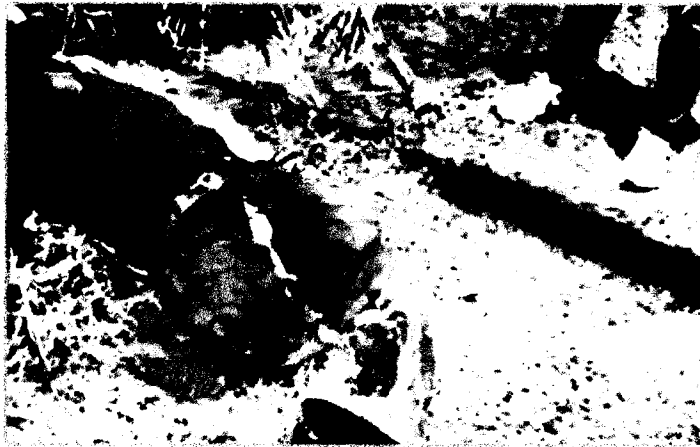
O motociclista acidentado teve fraturas expostas e perdeu as duas pernas

As circunstâncias do acidente serão apuradas pela polícia. Os nomes dos envolvidos no acidente não foram divulgados.