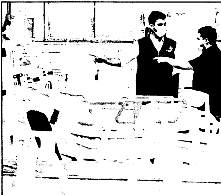
Entrega dos leitos fazem parte do plano de enfrentamento da Covid-19 em São Luís

O prefeito Eduardo Braide entregou na manhã desta terça-feira (16), 50 leitos exclusivos para atendimento a pacientes com casos moderados e graves de Covid-19, no Hospital da Mulher. A unidade será de referência da rede municipal de saúde. Os leitos estão divididos em 30 de enfermaria, 10 de Unidade de Terapia Intensiva (UTI) e 10 de Suporte Avançado. Com isso, somente nesta unidade, serão 20 leitos para atendimento especializado para pacientes em estado mais grave da doença. A entrega faz parte do Plano Municipal de Enfrentamento às Síndromes Respiratórias por meio do qual a Prefeitura de São Luís ofertará 120 leitos exclusivos para o tratamento dos pacientes infectados pelo coronavírus.