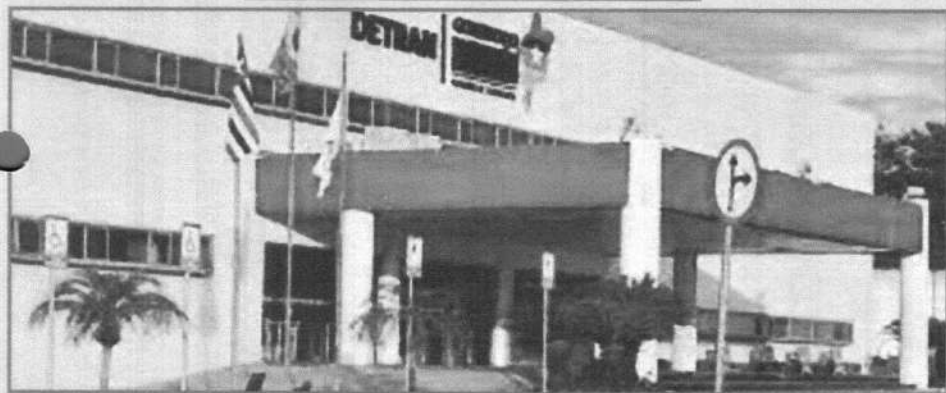
SEGUNDO O DETRAN, OS REAJUSTES ESTÃO DENTRO DO QUE PREVÊ A LEI

Segundo o órgão, o aumento da taxa de serviços está previsto em lei e, a partir de agora, o serviço de Vistoria Veicular vai ser feito por empresas terceirizadas