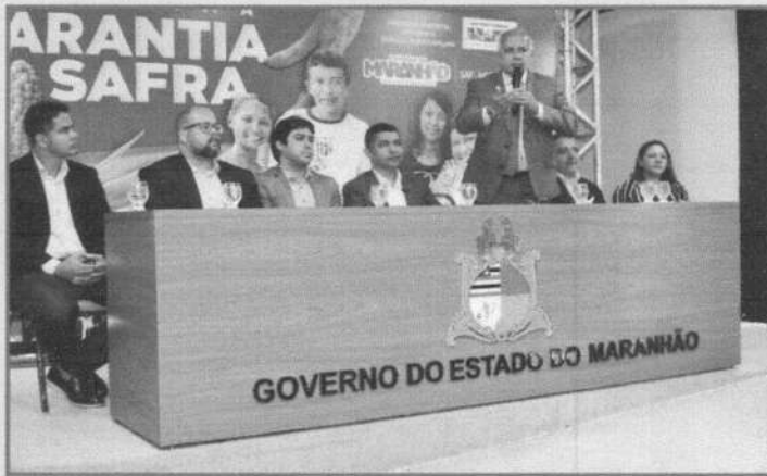
A CERIMÔNIA DE LANÇAMENTO DO PROGRAMA GARANTIA SAFRA 2023-2024, NO AUDITÓRIO DO EDIFÍCIO JOÃO GOULART

que 70 municípios tiveram perdas e impactos por conta do excesso de chuvas, então, esse programa existe para proteger as pessoas mais vulneráveis em cada um desses municípios", disse.