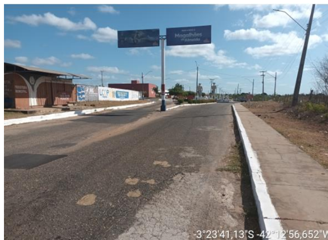
AVENIDA FRANCISCO TOBIAS DE CASTRO TRECHO - 01