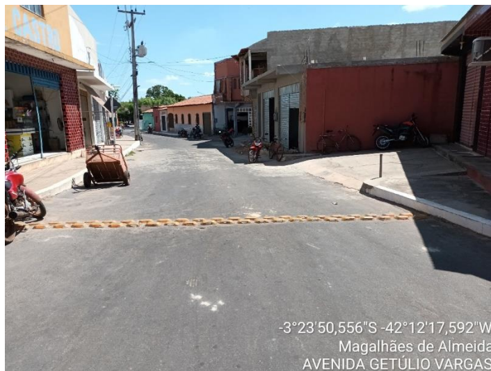
AVENIDA GETÚLIO VARGAS TRECHO 02