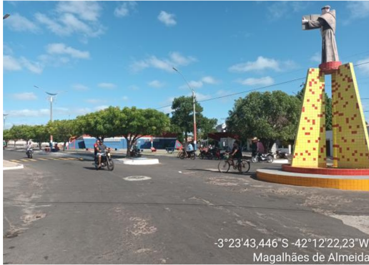
AVENIDA FRANCISCO TOBIAS DE CASTRO TRECHO - 02