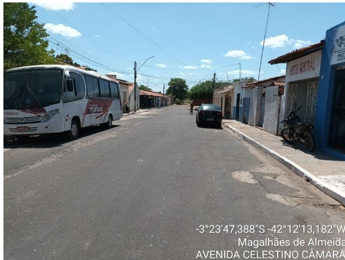
AVENIDA CELESTINO CAMARA