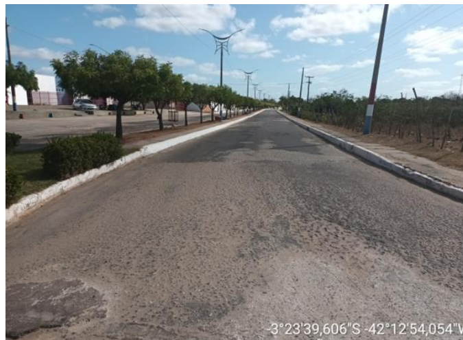
AVENIDA FRANCISCO TOBIAS DE CASTRO TRECHO - 01