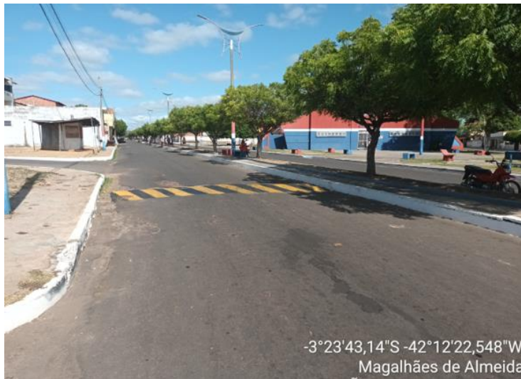
AVENIDA FRANCISCO TOBIAS DE CASTRO TRECHO - 02

-3°23'43,14"S -42°12'22,548"W Magalhães de Almeida