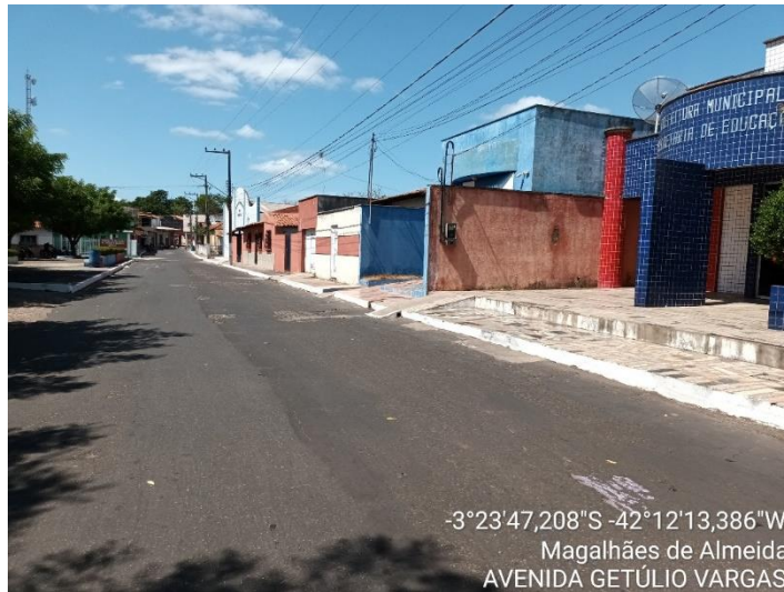
AVENIDA GETÚLIO VARGAS TRECHO 02