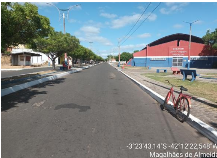
AVENIDA FRANCISCO TOBIAS DE CASTRO TRECHO - 02

-3°23'43,14"S -42°12'22,548"W Magalhães de Almeida