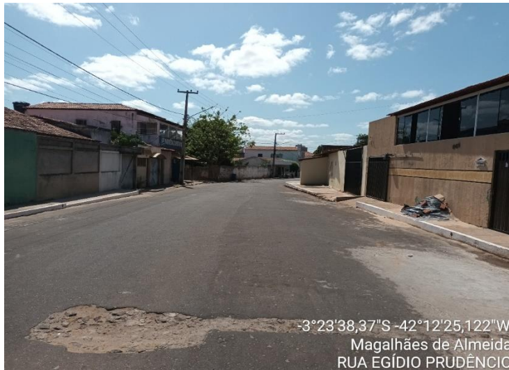
RUA EGÍDIO PRUDÊNCIO TRECHO 01