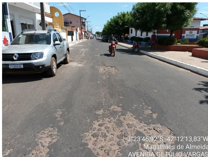
AVENIDA GETÚLIO VARGAS TRECHO 01

-3°23'46,92"S -42°12'13,83"W Magalhães de Almeida AVENIDA GETÚLIO VARGAS