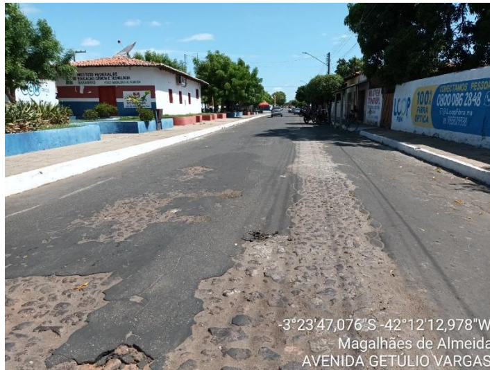
AVENIDA GETÚLIO VARGAS TRECHO 02