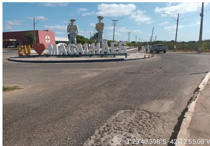
AVENIDA FRANCISCO TOBIAS DE CASTRO TRECHO - 01