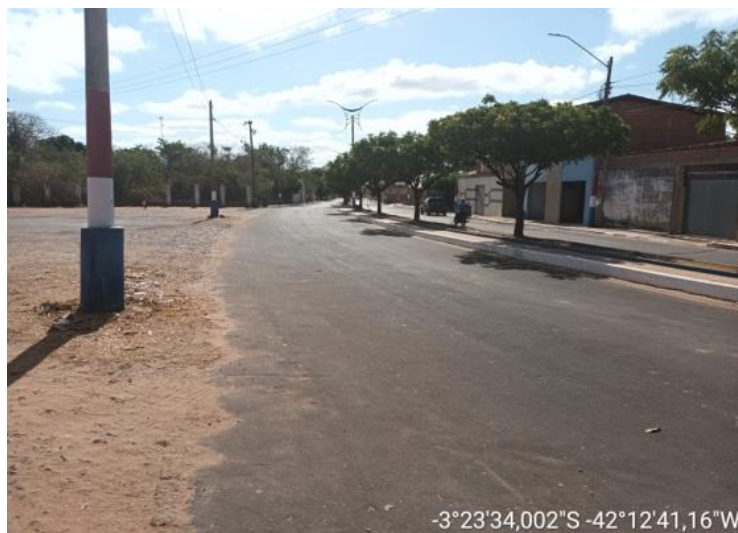
AVENIDA FRANCISCO TOBIAS DE CASTRO TRECHO - 02