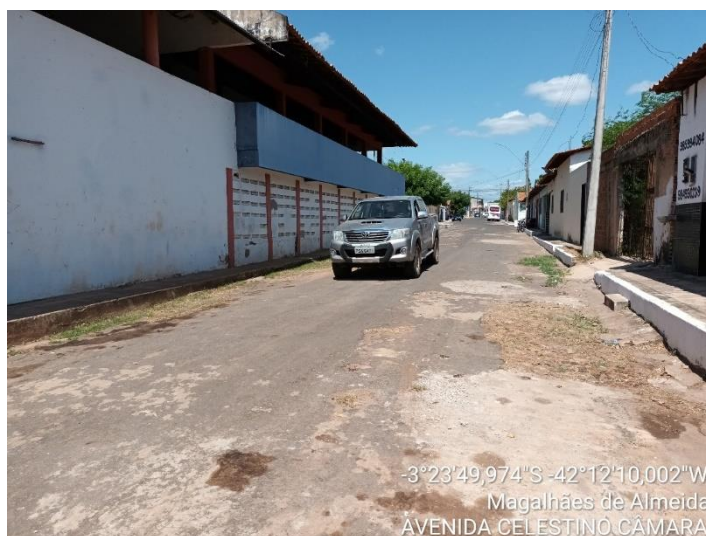
AVENIDA CELESTINO CAMARA