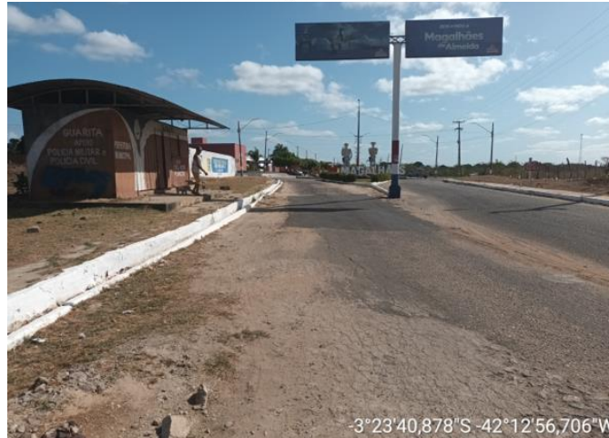
AVENIDA FRANCISCO TOBIAS DE CASTRO TRECHO - 01